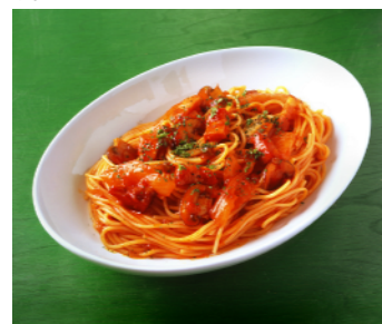
厚切りベーコンのナポリタン