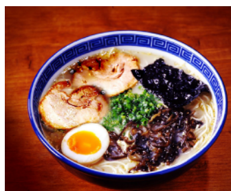
九州屋台ラーメン