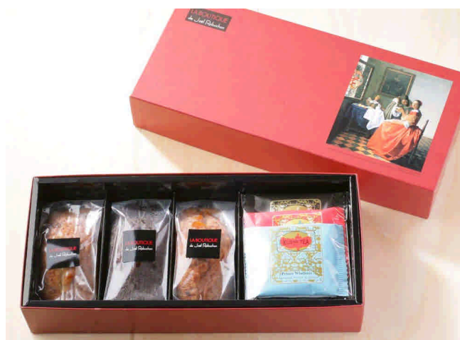
ケーキ・紅茶セット 2520円(税込み)