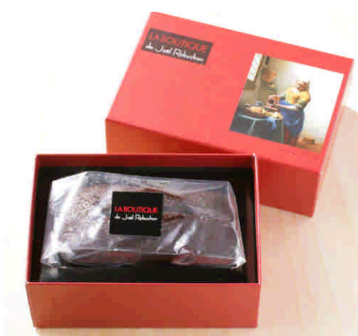
ケーキショコラ 840円(税込み)