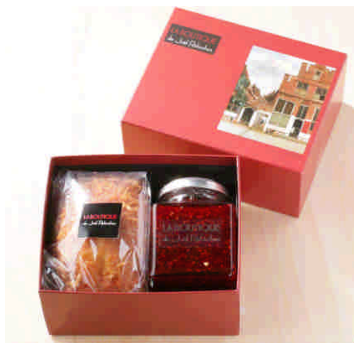
ジャムセット 2520円(税込み)