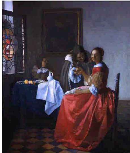
Johannes Vermeer “The Girl with wineglass”

ヨハネス・フェルメール(1632-1675)は、オランダのハーグ近くのデルフトという小都市に生まれました。彼がその生涯で残した作品は、わずか三十数点。この作品の少なさと、光を紡ぐ独特の技法の美しさから、彼は光の天才画家といえるでしょう。