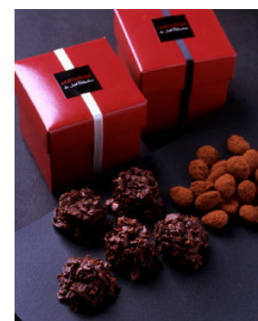
右がアマンド ショコラ

概要: キャラメルコーティングした皮付きのアーモンドを、チョコレートでコーティングしました。アーモンドの食感と、チョコレートと程よいカカオの風味が絶妙なコンビネーションです。