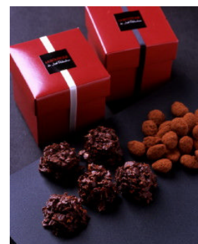
左がロッシェ ショコラ ノワール マルコナ

概要: 心地よい食感のロッシェ ショコラです。香ばしくローストしたスペイン・マルコナ産のアーモンドは濃厚な甘味がアクセントとなっています。軽やかな食感をお楽しみいただけます。