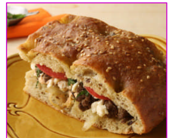
牛肉とフェチーアのキリシヤ風サンド