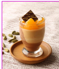
プラリネショコラ ～カルダモンの香り～