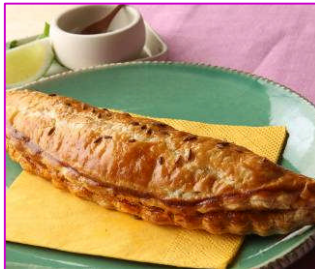
アジアンミートパイ