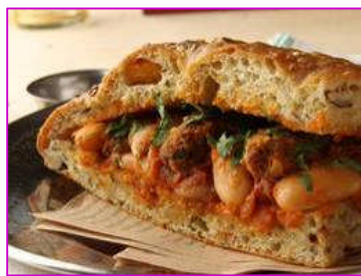
ケフタ サンドイッチ ～モロッコ風仔羊のサンド～