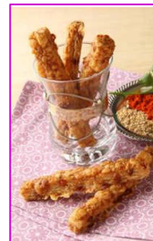
ゴータチーズパイ ～10種類のスパイスと～