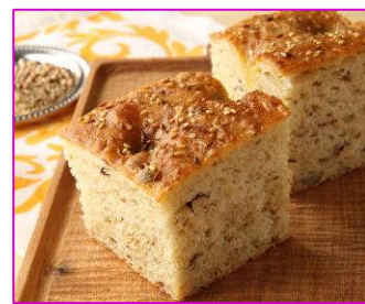
クミンとコリアンダのフオカッチャ