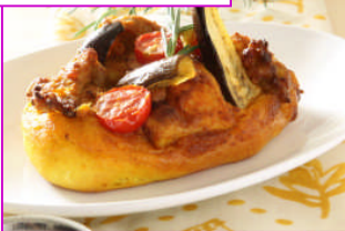
7種スパイスのタンドリーチキンフオカッチャ