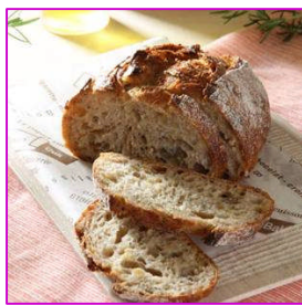
生姜とローズマリーのカンパーニュ