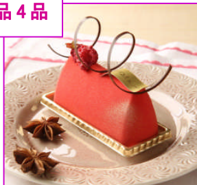
アニス フランボワーズ