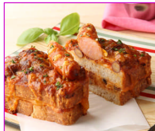
チリソリとチリピーンスのクロックムッシュ