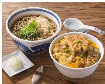
【カツ丼とお蕎麦のセット】