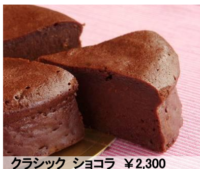
クラシック ショコラ ¥2,300