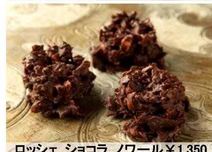
ロッシェ ショコラ ノワール ¥1,350