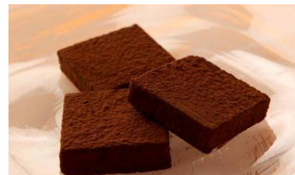
キャラド ロブション ナチュラル ¥1,600