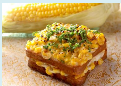
とうもろこしのクロックムッシュ