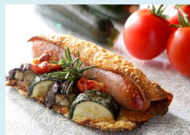
ハーブソーセージと夏野菜