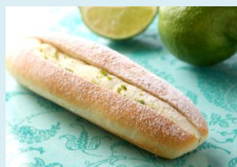
ライムクリームの ミルクフランス