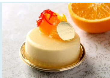
オレンジ オレンジとパッションのムース