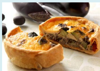
夏野菜とツナのキッシュ