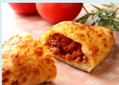
トマトとタコのフォカッチャ