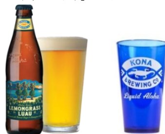
コナビール 特製アクリルカップ