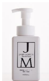
薬用泡ハンドソープ 400ml ¥1,093(税抜)