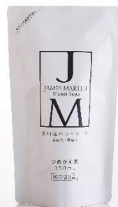
薬用泡ハンドソープ 詰め替え用 350ml ¥647(税抜)