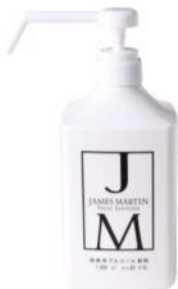
フレッシュサニタイザー シャワーポンプ付1000ml ¥2,000(税抜)