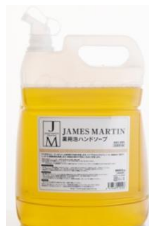
薬用泡ハンドソープ 業務用詰め替え式 5kg ¥5,500(税抜)