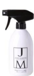
フレッシュサニタイザー トリガー付 500ml ¥1,239(税抜)